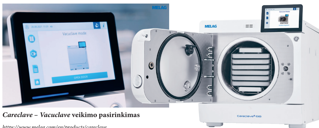
Careclave – Vacuclave veikimo pasirinkimas

https://www.melag.com/en/products/careclave