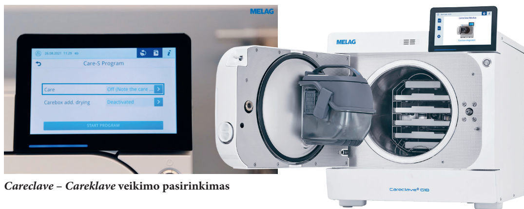
Careclave – Careklave veikimo pasirinkimas